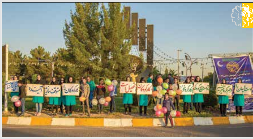
پاسارگاد: به مناسبت روز جهانی کار کودک، حلقه انسانی توسط کودکان کار نیکان تشکیل شد.

پاسارگاد: ثبت نام دوره های آموزشی ترم تابستان ۱۹۶ انجمن نمایش سیرجان آغاز شد. در این دوره آموزشی قرار است رشته هایی چون: نمایشنامه نویسی، بازیگری مقدماتی تئاتر، نمایش خلاق و ویژه گروه سنی ۱۲ تا ۱۵ سال، پرورش بیان نمایشی در زندگی شخصی و اجتماعی ۱۲ سال به بالا و چهره پردازی (گریمر تئاتر) آموزش داده شوند. علاقمندان جهت ثبت نام میتوانند همه روزه صبح هاز ساعت ۱۳ تا ۹ و عصرها از ساعت ۱۷ تا ۲۱ به سه راهی کرمان ابتدای بلوار سردار جنگل مجموعه فرهنگی تالار فردوسی مراجعه نموده و یا با شماره تلفن های: ۰۹۱۳۸۲۶۴۸۰، ۰۹۱۳۲۷۸۲۵۵، ۰۹۱۳۲۱۷۸۴۴۱ تماس حاصل نمایند.