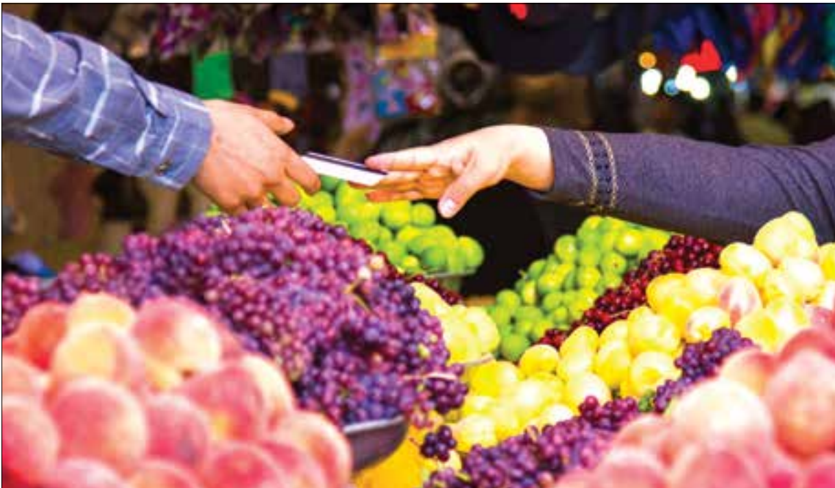
به زودی براساس بخشنامه جدید نرخ‌گذاری میوه انجام و فروشندگان موظف به وزن بر حسب قیمت روی میوه است

قیمت میوه‌های خارجی نظیر موز، انبه و... اظهار کرده «همی توانیم نرخ میوه‌های خارجی را در دست بگیریم. اگر این میوه‌ها وارد میدان شوند حریم نرخ برایشان مشخص می‌شود اما اتفاقی‌ها خودسرانه فروش را در دست گرفتند.» ریسس میدان‌دارن میوه و تره‌بهار درباره افزایش قیمت خیارسیز نیز گفته: «کشت کم شده است. هر چند خیار در گلخانه‌ها کاشت می‌شود اما شهرهای اطراف از سیرجان جنس می‌برند. ما به درصد خودمان قطعیم. جنس را با هر قیمتی بدهند همان ۶-۵ درصد را می‌گیریم.»