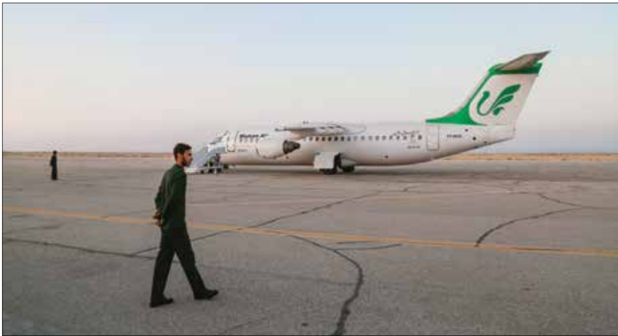
عکس: امین ارجمند | پاسارگاد

هستیم که مهمان کشوری زیادی داریم و باید این جاده درست شود وی اضافه می‌کند: متأسفانه این جاده اصلاً در شان سیرجان نیست. با توجه به اینکه هر هفته ۱۴ پرواز ورود و خروج از سیرجان داریم و با توجه به اینکه این پروازها در شب انجام می‌شود هر چه سریعتر جاده فرودگاه باید بهسازی شود. موسسای پور تصریح می‌کند: مثلاً آمدند تیر برق‌ها را نصب کرده‌اند اما تا روشنایی وصل نشود عملاً کاری انجام نشده. لاین رفت هم کار دارد. دست‌اندازه‌های زیادی دارد که باید درست شود. به گفته رییس فرودگاه: «یک موقع دستگاه‌های لاری به صورت اداره است اما یک زمانی مرجع اصلی شهر است و فرمانداری طرف حساب ماست. اجرای این طرح بر عهده فرمانداری است. یعنی از محل اعتبارات شهرستان است که فرمانداری تخصیص می‌دهد. فرمانداری هم مشکل اعتباری دارد و ما را به آینده ارجاع می‌دهد ولی لازم است که کار سریع‌تر انجام گیرد.» رییس فرودگاه به سفر مهم ریاست‌جمهوری به سیرجان اشاره می‌کند و می‌گوید: سفر ریاست جمهوری را در پیش داریم و باز هم باید از این مسیر نامناسب عبور کنند. این جاده یکی از معضلات است. هم از لحاظ ایمنی، هم از نظر