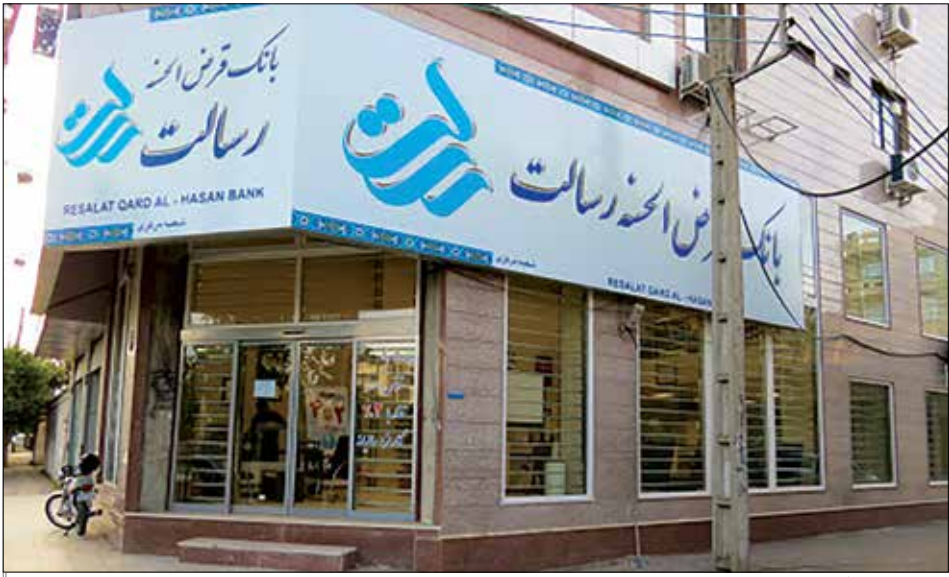
عکس تزئینی است

ذکر شده متأسفانه عدد باجه را یادداشت نکردم اما به گمانم آخرین عددی که نوشتش شده بود، ۴۴۷ بود.