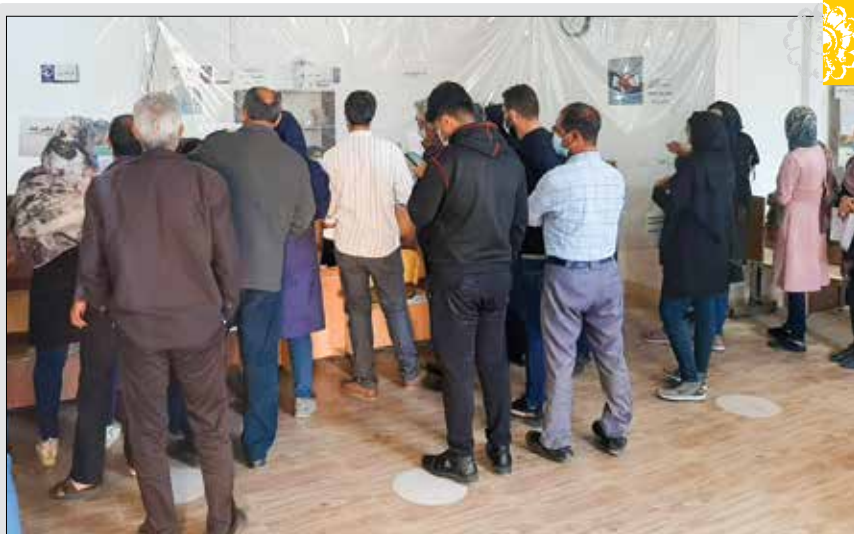
علیرغم نارنجی شدن وضعیت سیرجان و هشدارهای مسئولان کشوری و شهرستان مبنی بر رعایت پروتکل‌های بهداشتی بازم در ادارات و بانک‌ها این پروتکل‌ها رعایت نمی‌شود. این تصویر، صفت‌دهنده به مردم بدون رعایت فاصله اجتماعی است که مردم بدون رعایت فاصله اجتماعی کنار هم ایستاده‌اند.

بهروز افخمی پس از ازدواج با مرجان شیرمحمدی که همسر دوم وی بود به کانادا رفت تا فرزندش تبعه آن کشور محسوب شود. وی چند سال بعد به ایران بازگشت اما این‌بار رخسار عوض کرد. به تلویزیون آمد و برنامه هفت را در دست گرفت و همان ابتدا گفت می‌خواهد این برنامه را با رضایت مدیران تلویزیون و مخاطبانش بسازد. او در همین سال‌ها اظهار نظرهایی عجیبی در زمینه‌های مختلف مطرح کرده است. وی شهید آوینی را تأثیرگرفته از فرزند معرفی کرد و در خصوص جایزه جشنواره جهانی فیلم کن که به اصغر فرهادی و شهاب حسینی اعطا شده بود، گفت: در این جشنواره به فیلم‌هایی در خصوص دگرگراش جنسی جایزه می‌دهند. البته مشخص نشد اگر چنین موضوعی صحت دارد، پس چرا در سال‌های اخیر