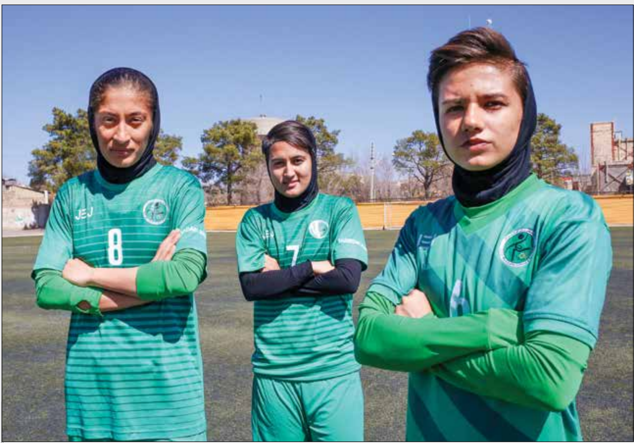
عکس: امین ارجمند | پاسارگاد