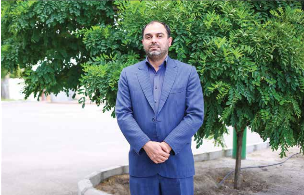
محسن سلاجقه؛ رییس جدید بنیاد مسکن

و می‌گوید: شاید نفراتی که زمین گرفته‌اند در لیست ما هم نباشند یا شاید فردی رفته باشد و چانه برادرش یا یکی از اقوامش را زده باشد. من اطلاعی ندارم. حتی ممکن است یکی از اقوام آقای ایکس که در شهرداری یا شورا است، در لیست و در اولویت بوده نیز ما به چشم شهروند به او نگاه کرده‌ایم اما اگر چنین فردی رفته در بنیاد و به جای نفر دهم زمین گرفته دیگرمن نمی‌دانم. به نظر می‌آید ۳ نفر مثلا ۱۰ نفری را اولویت اولی دادند و بقیه را از اولویت‌های ۸۰ و ۹۰ دادند. غیر از این‌ها به نظر می‌آید تعداد دیگری را بنیاد زمین داده است و ما از اسامی این‌ها خبر نداریم و این لیست را باید بنیاد و کند که به چه کسی زمین داده است.