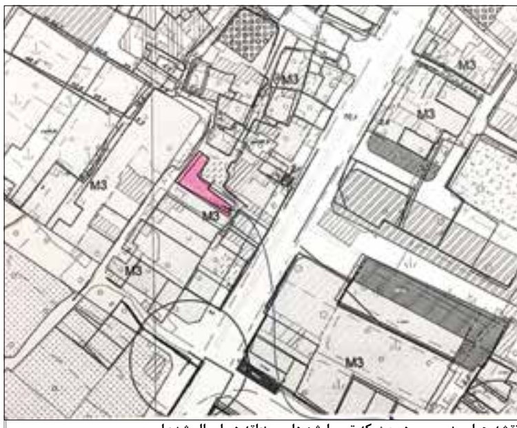
نقشه هوایی زمین مورد بحث که توسط شهرداری منطقه دو ارسال شده است

دوم اینکه پروانه دارم، من اگر پروانه نداشتم پلیس ساختمانی هر روز می آمد بپنجم را می گرفت، علاوه بر آن به من حتی امتیاز آب هم داده اند. او در رابطه با اینکه اهالی مدعی هستند شما با پارتی کارتان را جلو برده اید، گفت: به همان خدایی که شما می پرستید من چه پارتی داشته ام؟ مگر می شود یک اداره مثل شهرداری به خاطر یک زمین بی ارزش خودش را زیر سوال ببرد؟ مردم معترض بودند شکایت کنند ببینند پارتی من کیست، اصلا بروند بازرسی و حراست شهرداری. آن ها باید از طریق این مراجع اقدام کنند اگر به نتیجه نرسیدند بروند دادگاه شکایت کنند. وی افزود: حتی گفتم بروید نقشه کش شهرداری را بیاورید هر کجا تخلف کرده بودم عقب می روم. هر کاری بگویند من در خدمت شان هستم. من همه مستندات که دارم را می آورم نشان بدهم. من یک عالمه هزینه کردیم و زمین را خریدم و هیچ بی قانونی نکردم.