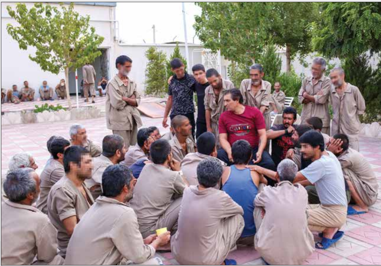
عکس: امین ارجمند | پاسارگاد