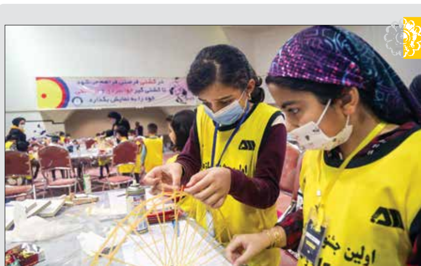
اولین دوره مسابقات سازهای ماکارونی توسط روابط عمومی و امور بین‌الملل شرکت گل‌گهر با حضور ۱۴۰ نفر از فرزندان ۸ تا ۱۸ سال کارکنان شرکت گل‌گهر هفته گذشته برگزار شد.

که کماکان نیز ادامه دارد. سرفه‌هایی که هر روز کوچک و کوچکتر شده است. قیمت‌های مواد خوراکی با سرعتی غیرقابل پیش‌بینی که عدم انطباق مصرف‌کننده را برای خرید در پی ندارد. مقابل چشمان همگان ظاهر می‌شود. مردم منابع مهم تغذیه‌ای را از سفره خود قلم گرفته‌اند. گوشت فرمز و گوشت مرغ که مدت‌هاست از سبد غذایی خانوارها حذف